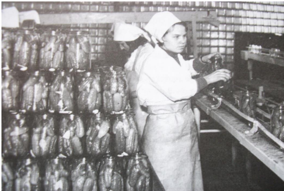
Rys. 3. Przetwórnia „Las”, rok ok 1980.