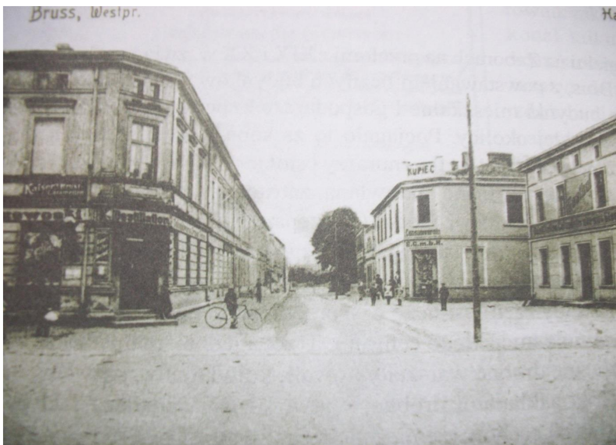
Rys. 1. Ulica Główna w Brusach, rok o 1900.