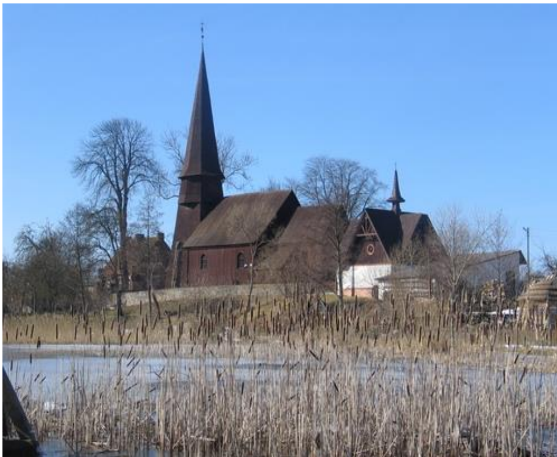
Rys. 5. Kościół pod wezwaniem „Podwyższenia Krzyża św.” w Leśnie.