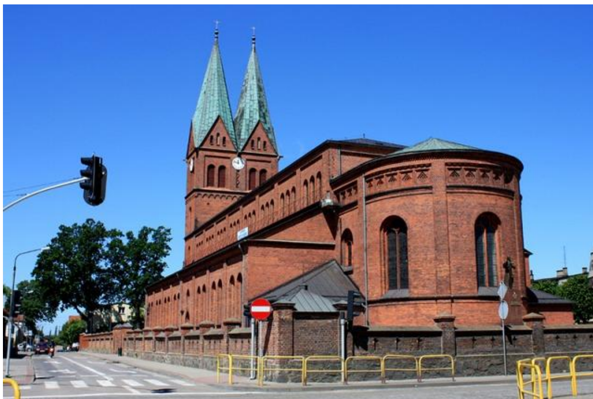
Rys. 4. Kościół pod wezwaniem „Wszystkich Świętych” w Brusach.