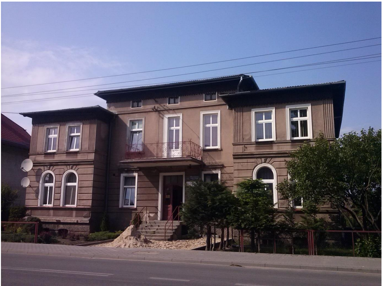
Rys. 8. Ośrodek w domu Austenów (stan obecny).

W związku z ograniczonym dostępem biednej ludności wiejskiej do opieki zdrowotnej (brak transportu, a przede wszystkim ubezpieczenia zdrowotnego) społeczność Brus i okolic wykorzystywała niekonwencjonalne metody leczenia lub omijała wizytę u lekarza i kierowała się do apteki. Na początku XX w. aptekarz pełnił rolę „wyroczni” wysłuchał polecił i zaordynował wskazany przez siebie medykament. Pierwsza wzmianka o aptece pojawia się w 1913 r. W niezbędne leki można było zaopatrzyć się również w „M. Wenda Drogerie Zum Goldenen Adler Farben, Kolonialwaren und Delikatessen” (nazwa własna). W 1960 r. w Leśnie utworzono punkt apteczny, który istnieje do dziś.