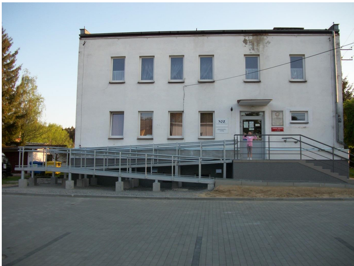
Rys. 7. Filia Ośrodka Zdrowia w Leśnie. (Stan obecny)