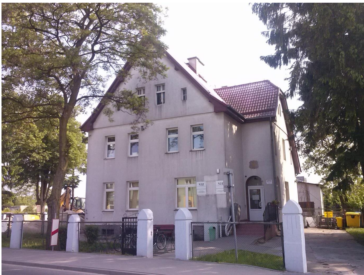
Rys. 6. Ośrodek przy ul. Dworcowej (stan obecny).